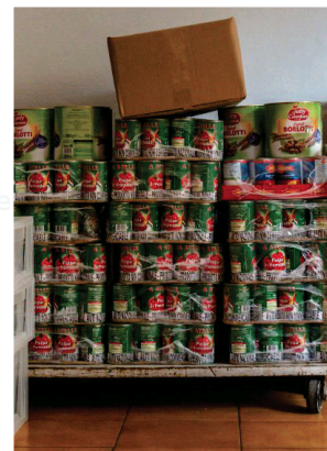
C'è sempre più fame

mo il vantaggio della prossimità e dunque la possibilità di individuare con più facilità chi si trova in difficoltà e metterlo così in contatto con i relativi servizi. Nei prossimi mesi dovremo dunque capire rispettivamente anticipare quali potranno essere i problemi e le soluzioni da adottare. È a ogni modo chiaro che dal contesto della cittadinanza provengono segnali allarmanti. Si sente sempre più spesso parlare di licenziamenti, riduzione del lavoro e ciò provoca nel cittadino incertezza e una costante mancanza di punti saldi, dunque la preoccupazione c'è senz'altro. La gente è più sensibile, ha più paura. Come Comune rispondiamo a questi bisogni con la presenza di diversi servizi attivi a favore della popolazione, soprattutto per le fasce più vulnerabili e in difficoltà».