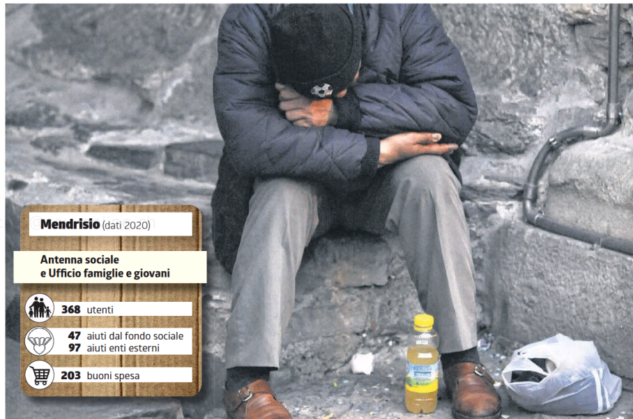
Spesso per compagnia vi è la disperazione

Dal capoluogo a Stabio sempre più famiglie vivono una crisi non più solo finanziaria